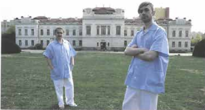
MINA. Lapidul profesorů Roštlapila , 2011. slideshow.

usklíbnutí. Když se ale začneme hlouběji zabývat spojeními, která se otevírají mezi moderními institucemi sloužícími vládnutí, vzdělávání a biopolitické regulaci populace, uvědomíme si, kolik