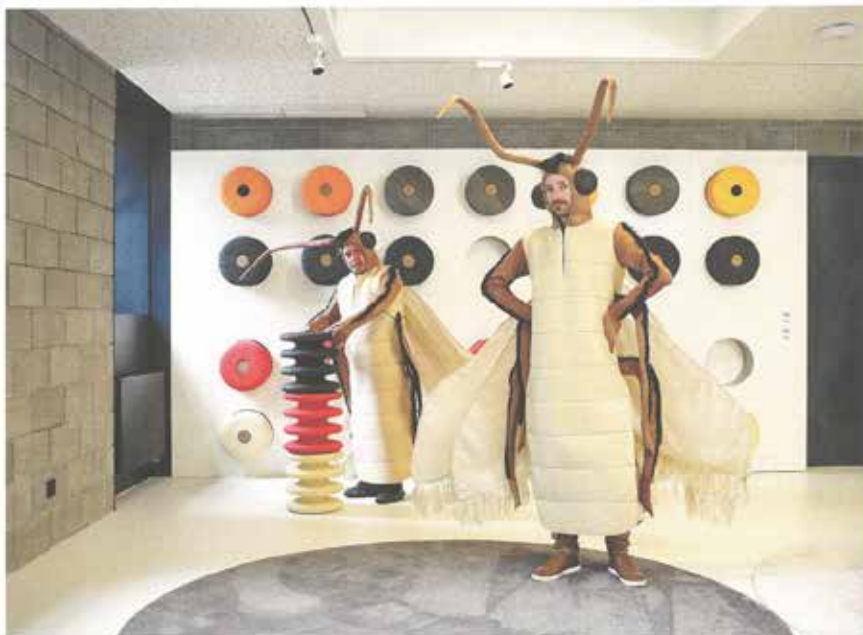
MINA, Škádci, 2018, fotoperformance.

Roštlapila, byl doveden k dokonalosti v dosud posledním projektu MINA. Místně specifickým projektem Škádci reagovali Mikulášik s Nálevkou na pozvání zúčastnit se skupinové výstavy tematizující práci autorských dvojic nazvané Dvě hlavy čtyři ruce (2018), která se uskutečnila v humpolecké galerii 8smička. Tato galerie, respektive „zóna pro umění“, jak sama sebe nazývá, sídlí v prostorách bývalé textilní továrny, na kterýžto fakt reagovala inaugurační výstava Počta suknu , 8smička patří k novému druhu privátních galerijních institucí, které nastavují zrcadlo zavedeným veřejným institucím často mírně odlišnými, více přátelsky orientovanými druhy provozu, ale také často nekompromisním, kvalitním designem. Právě na tuto okázalou designovanost vnitřních prostorů i vnějšku galerie, stejně jako na historii samotné budovy reagovala MINA sérií fotografií, v nichž umělci, kteří se po téměř čtvrtstoletí spolupráce již posunuli do středního věku, pózuji v zakázkově vyrobených kostýmech (návrh Anny Pospíšilové) molů šatních před objektivem profesionálního fotografa Jiřího Hroníka. Mladistvý elán zračící se v tvářích studentů umění, kteří se v roce 1999 nechali portrétovat v Bretani, nahradily tařkovské, lehce posmutnělé grimasy přerostlého hmyzu, se kterým nechceme mít co do činění.