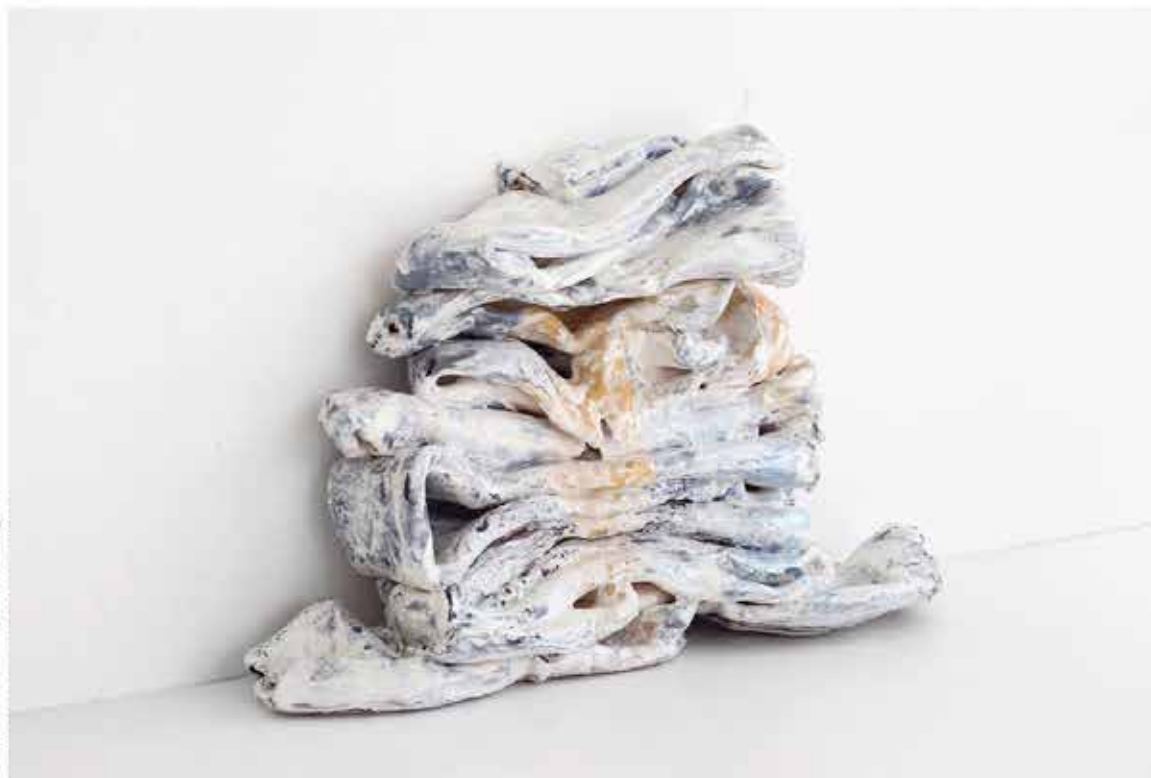
Charlotte Dualé, Schicht, 2017, keramika, glazura